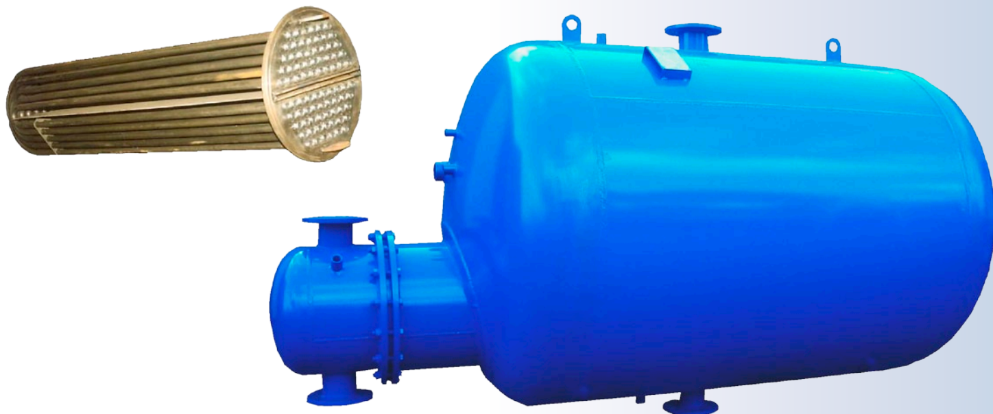
Wymiary i powierzchnie ogrzewalne wymienników pojemnościowych typu WP6